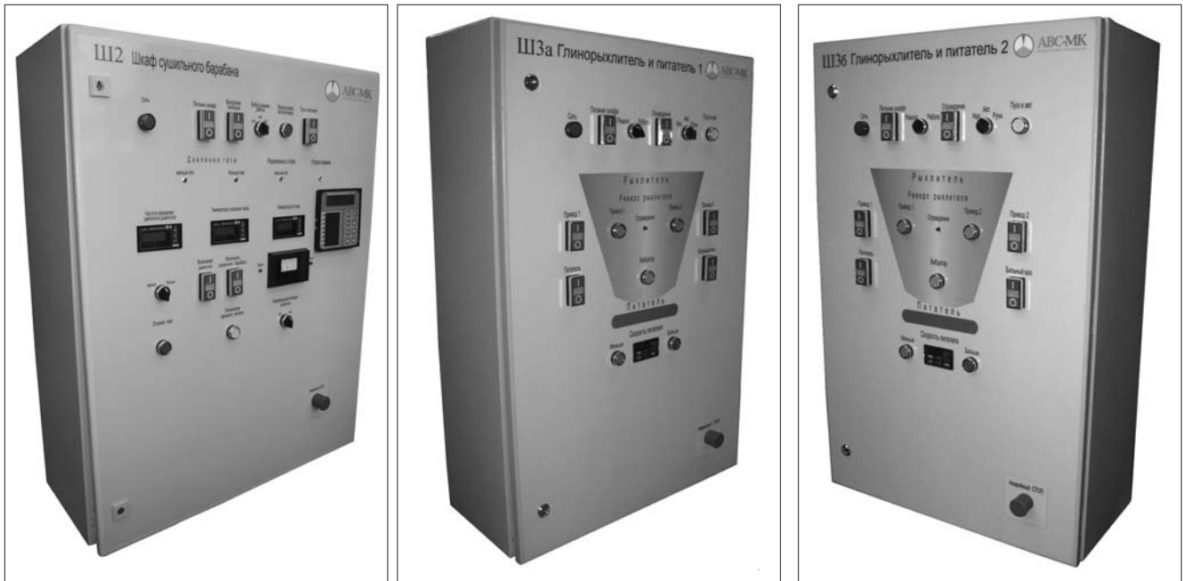
Рис. 1. Шкафы системы автоматизации управления комплексом изготовления керамического кирпича «Sinaps Керамика»

тем происходит размол гранул в стержневых мельницах. Для достижения необходимой влажности на выходе материала из накопительных бункеров устанавливают измеритель расхода материала в виде весового ролика и датчика скорости ленты транспортера, датчик влажности (непосредственно в поток материала).